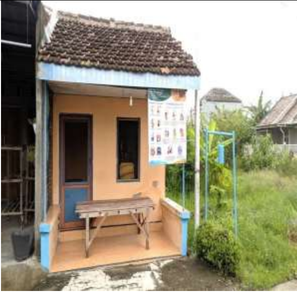
POS KAMPLING RT 09 RW 03