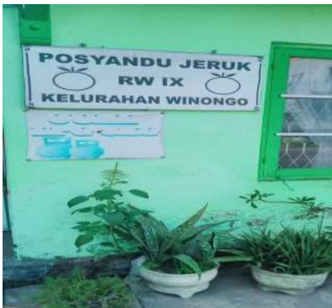
POSYANDU JERUK RW.09