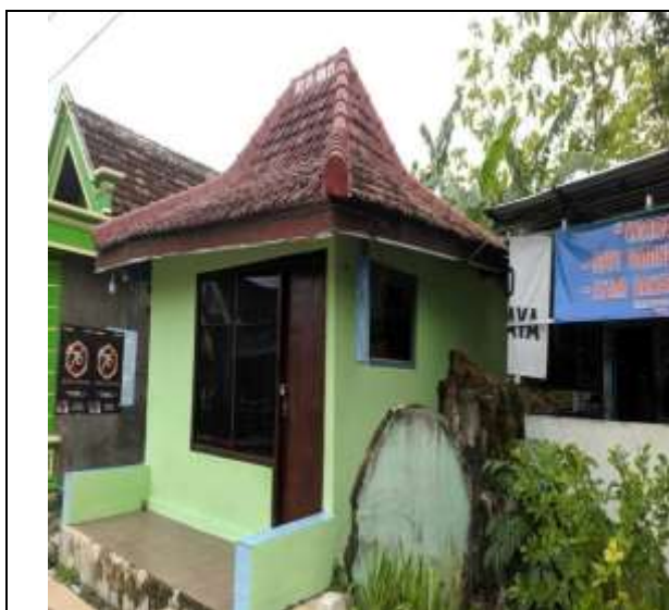
POS KAMPLING RT 01 RW 01