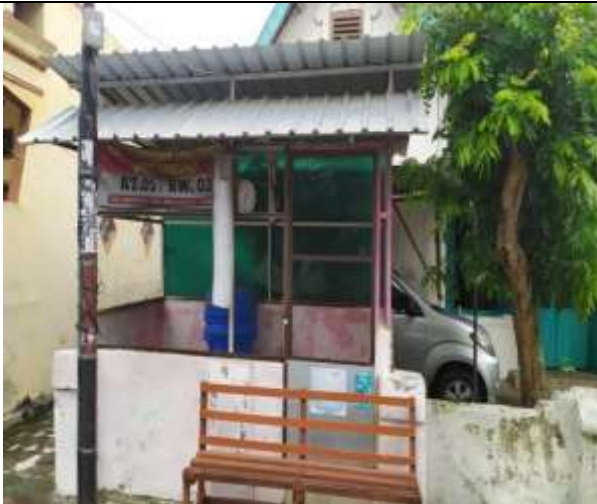
POS KAMPLING RT 05 RW 02