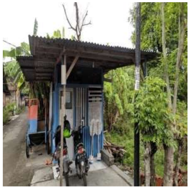
POS KAMPLING RT 20 RW 09