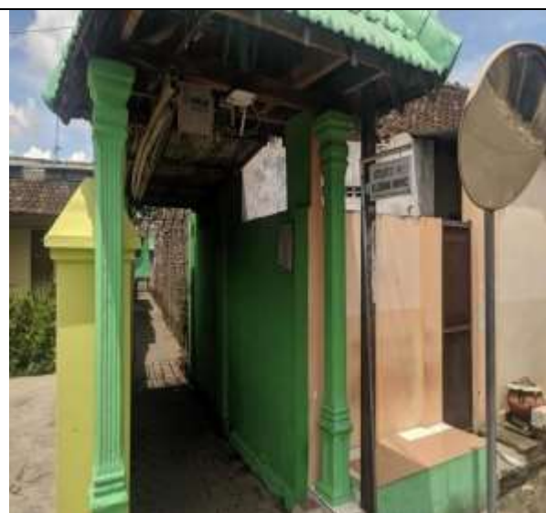
POS KAMPLING RT 02 RW 01