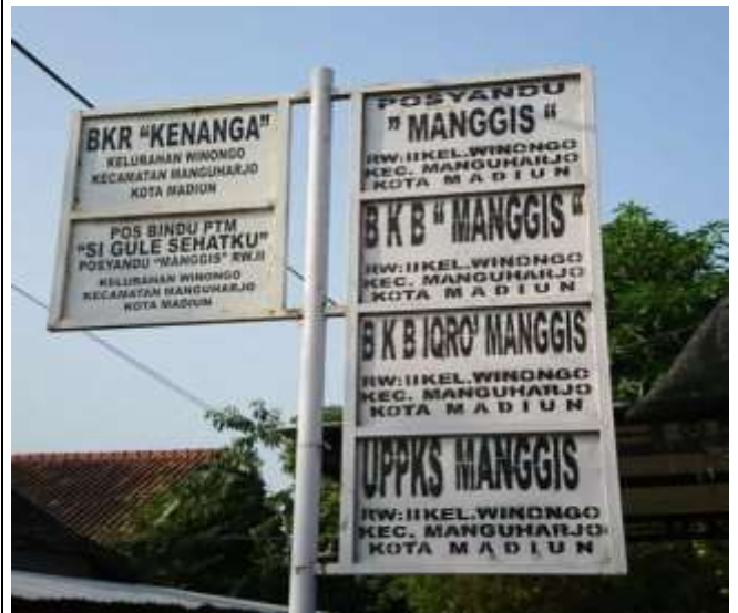
POSYANDU MANGGIS RW.02