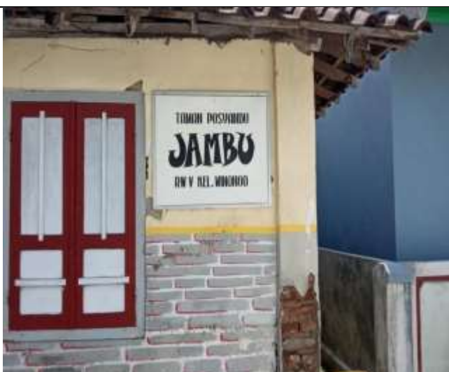
POSYANDU JAMBU RW.05