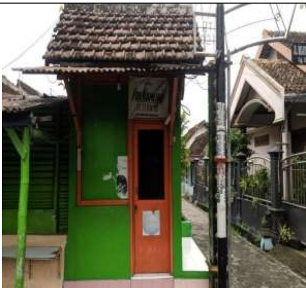
POS KAMPLING RT 21 RW 09