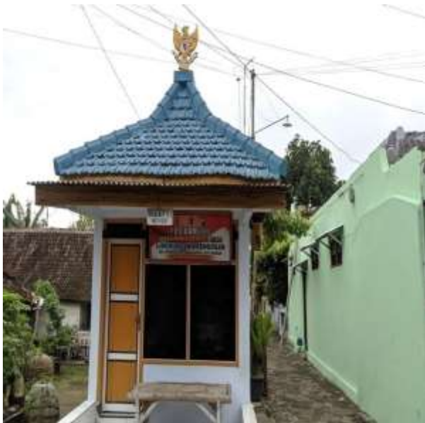
POS KAMPLING RT 15 RW 05