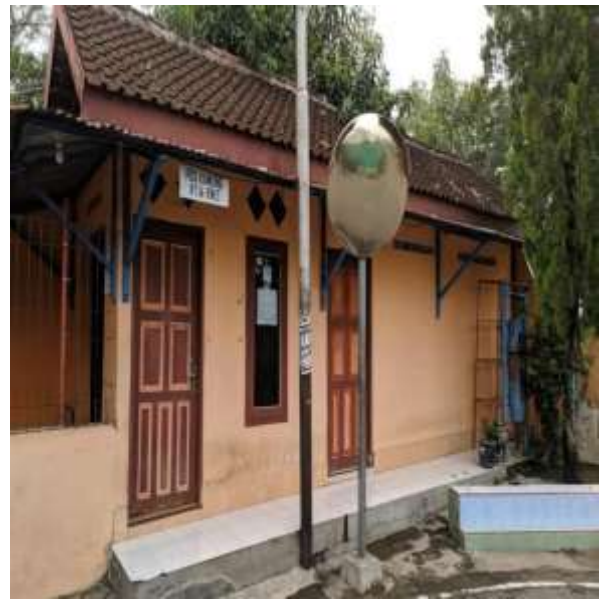
POS KAMPLING RT 14 RW 05