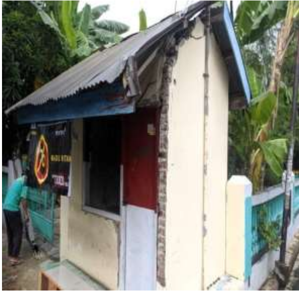
POS KAMPLING RT 25 RW 08