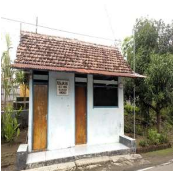
POS KAMPLING RT 17 RW 06