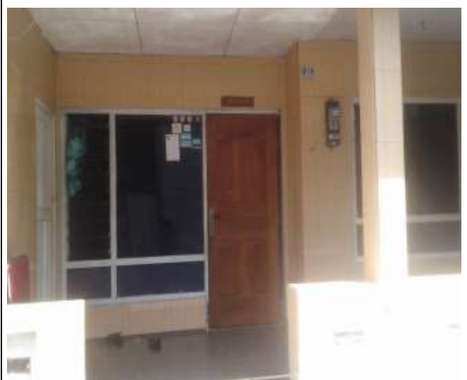
POSYANDU DELIMA RW.04