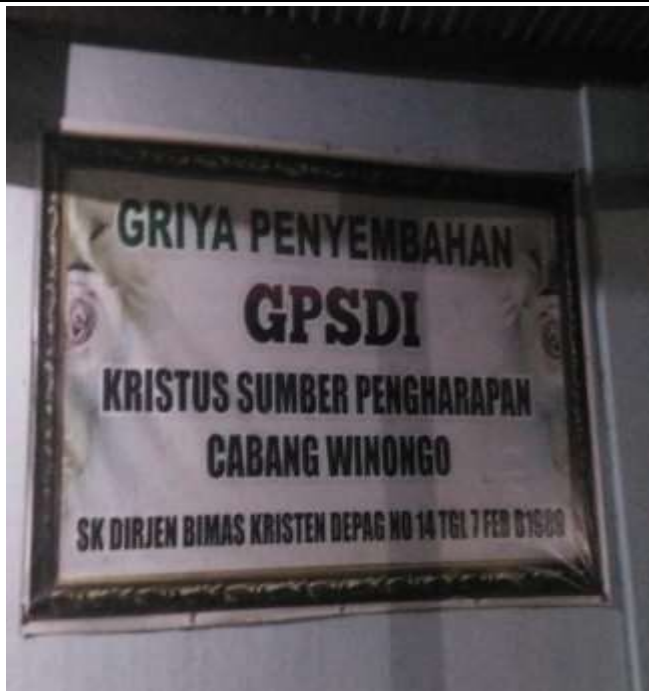
GEREJA SUMBER PENGHARAPAN