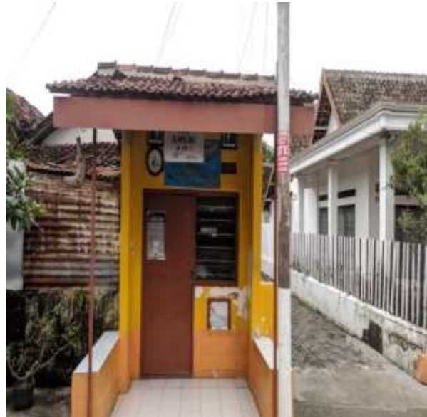
POS KAMPLING RT 28 RW 06