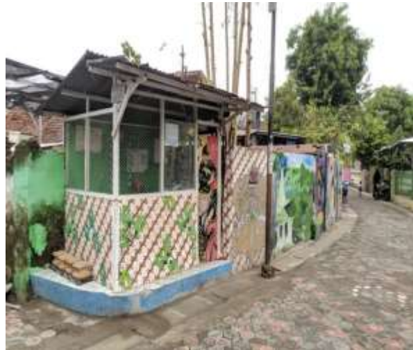
POS KAMPLING RT 06 RW 02