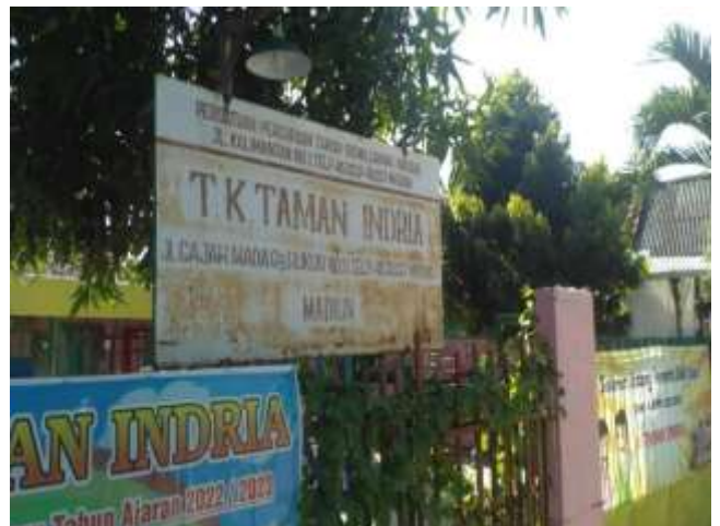
TK TAMAN INDRIYA