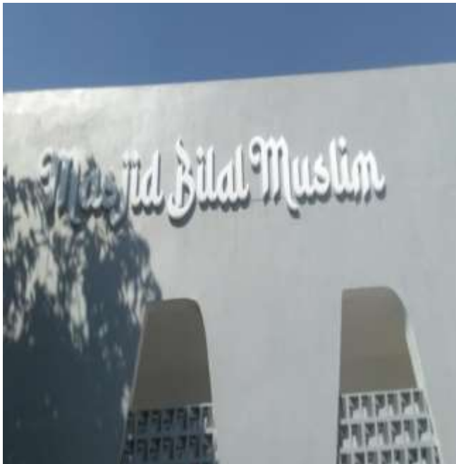
MASJID BILAL MUSLIM