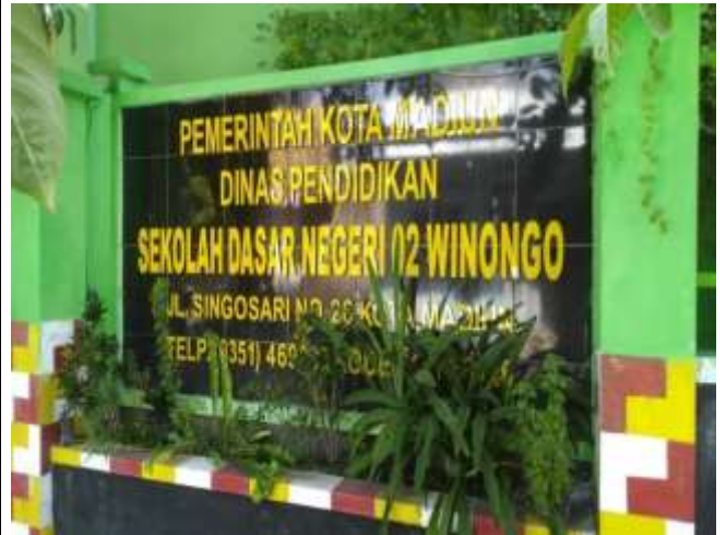
SD NEGERI 02 WINONGO