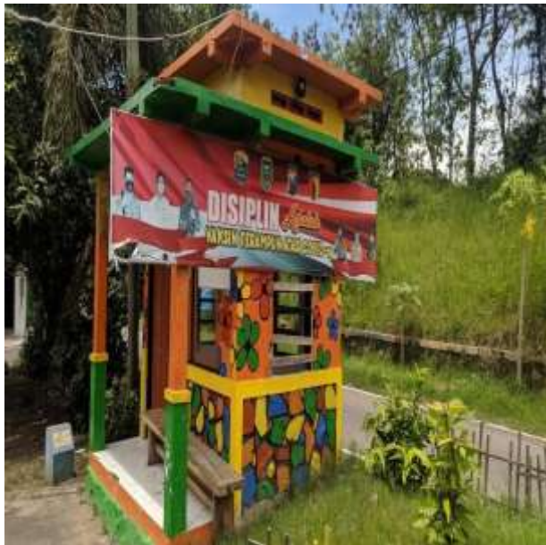
POS KAMPLING RT 31 RW 10