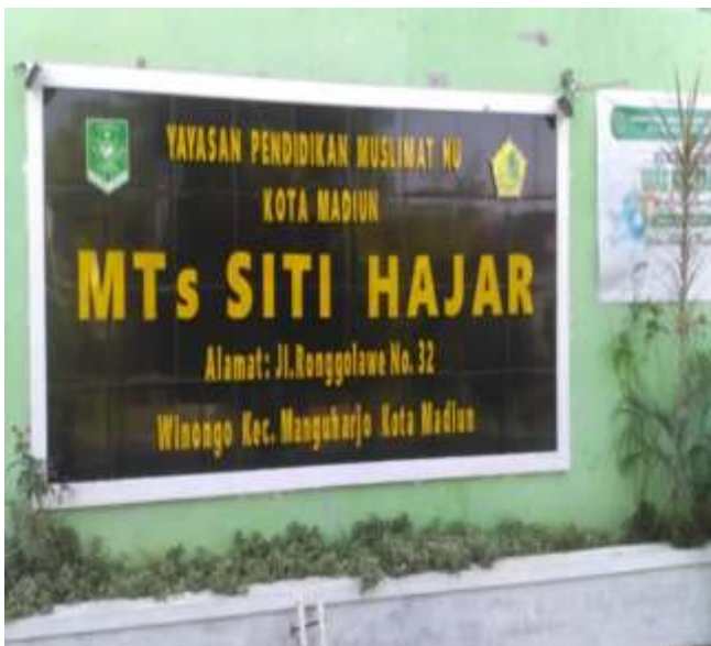
MTS SITI HAJAR