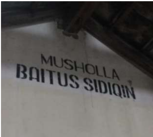
MUSHOLA BAITUS SIDIQIN