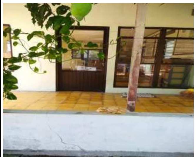
POSYANDU APEL RW.06