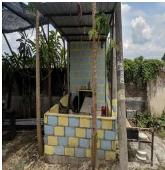
POS KAMPLING RT 36 RW 03