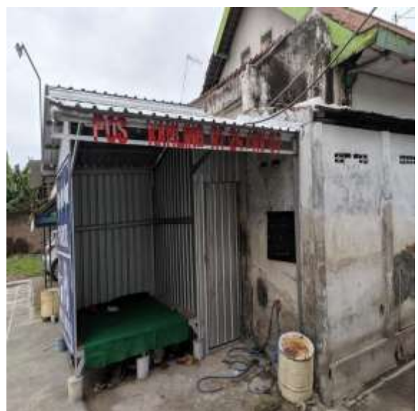
POS KAMPLING RT 24 RW 07