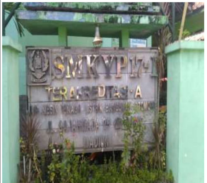
SMK YP 17-1 MADIUN