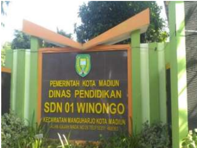
SD NEGERI 01 WINONGO