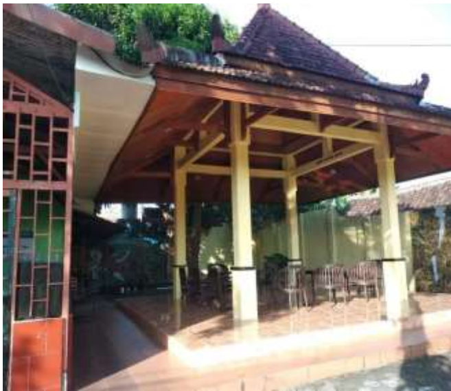
POSYANDU ANGGUR RW.01