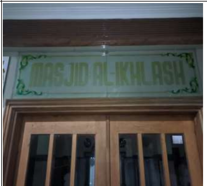
MASJID AL-IKHLASH MANGIR