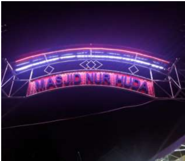
MASJID NUR HUDA