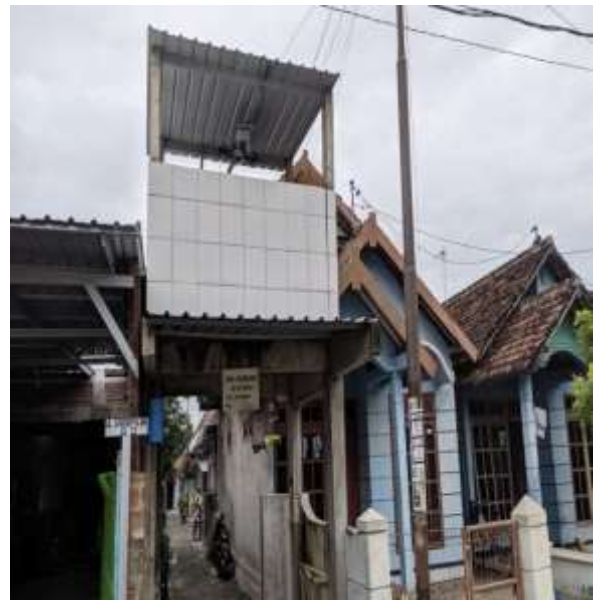
POS KAMPLING RT 08 RW 02