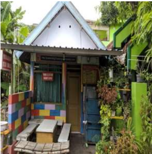
POS KAMPLING RT 07 RW 02