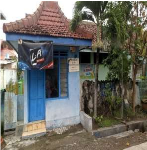
POS KAMPLING RT 11 RW 03