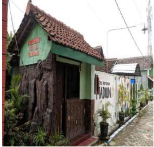
POS KAMPLING RT 04 RW 01