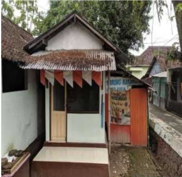
POS KAMPLING RT 19 RW 06