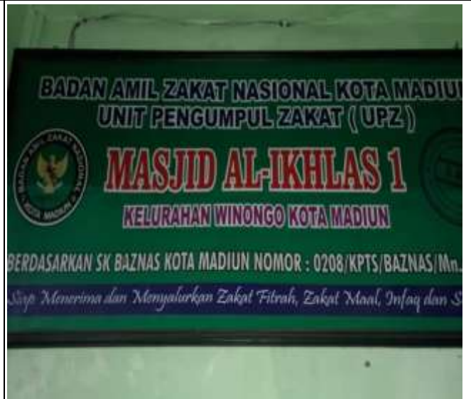
MASJID AL-IKHLAS SULTAN AGUNG