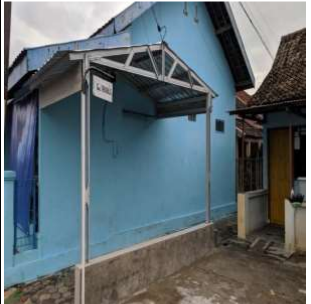
POS KAMPLING RT 12 RW 04