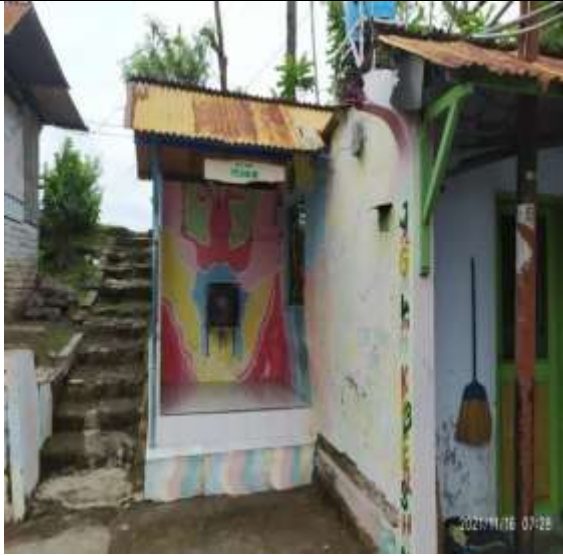
POS KAMPLING RT 03 RW 01