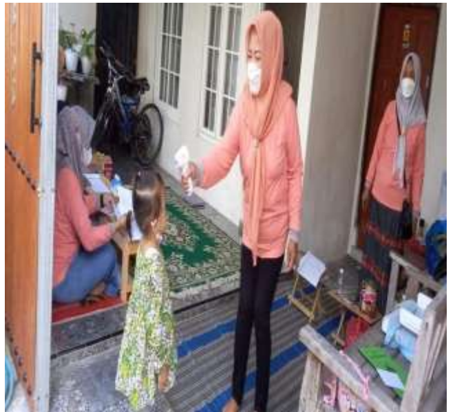
POSYANDU MUNDU RW.10