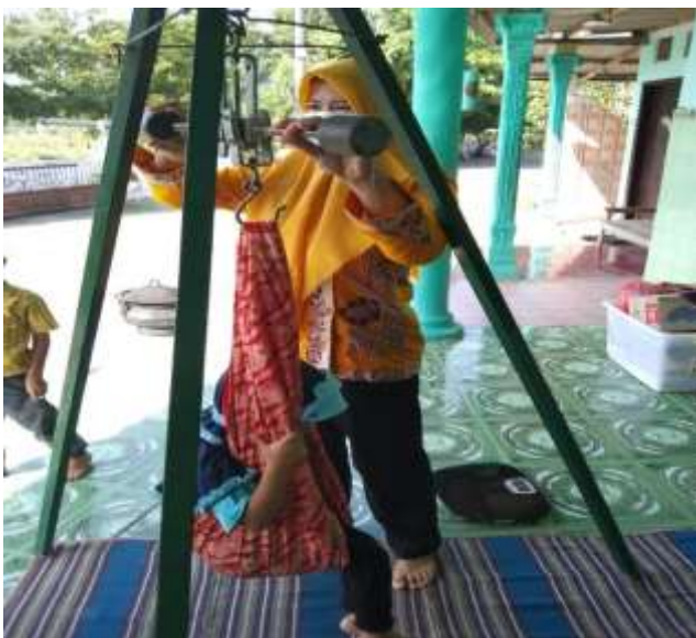
POSYANDU NAGA RW.11