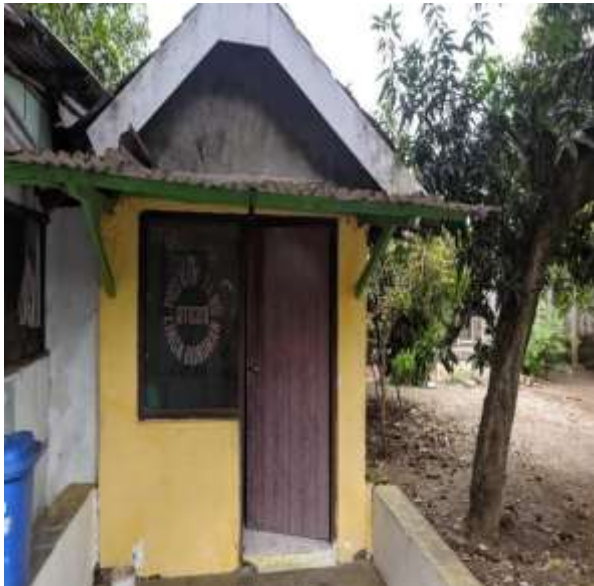
POS KAMPLING RT 27 RW 08