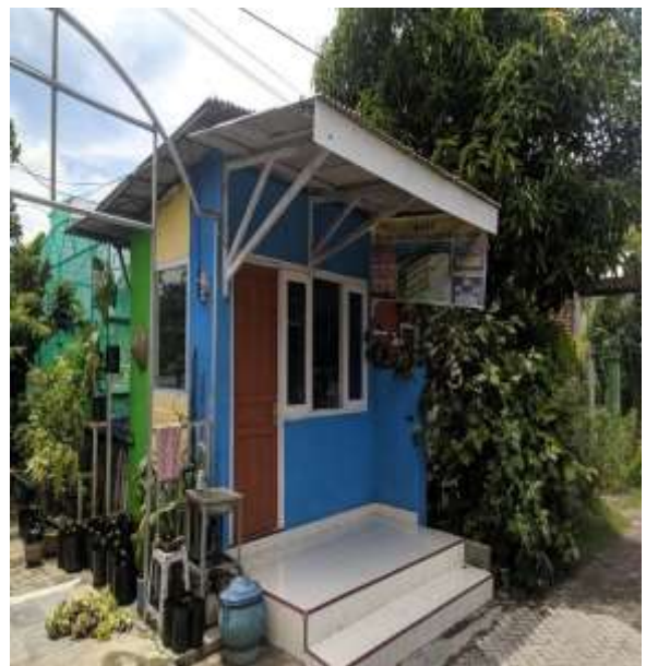
POS KAMPLING RT 34 RW 10