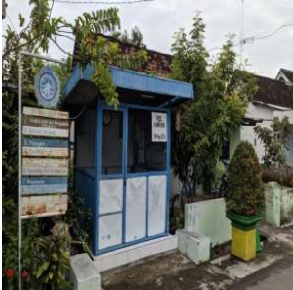
POS KAMPLING RT 13 RW 04