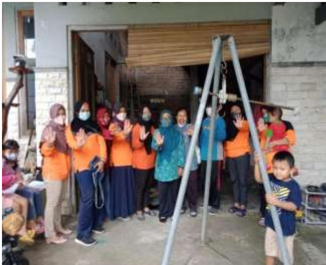
POSYANDU DURIAN RW.03