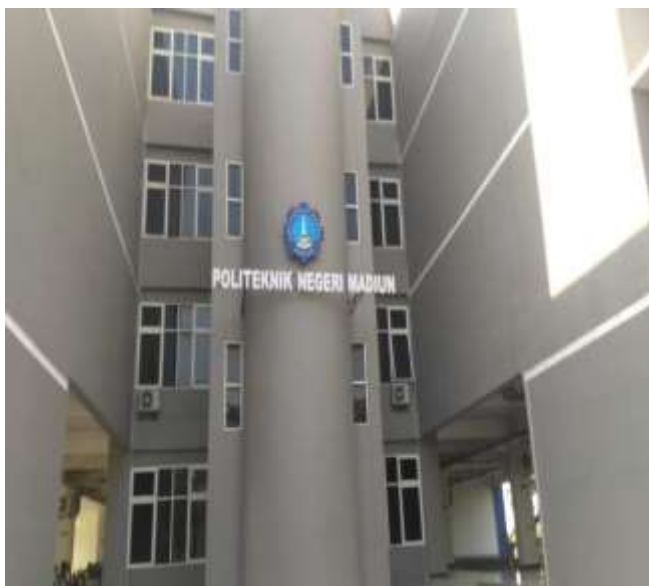
POLITEKNIK NEGERI KAMPUS 2