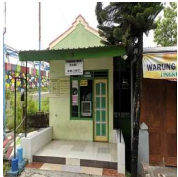
POS KAMPLING RT 16 RW 05