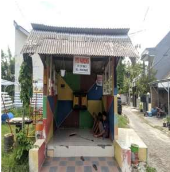
POS KAMPLING RT 29 RW 10