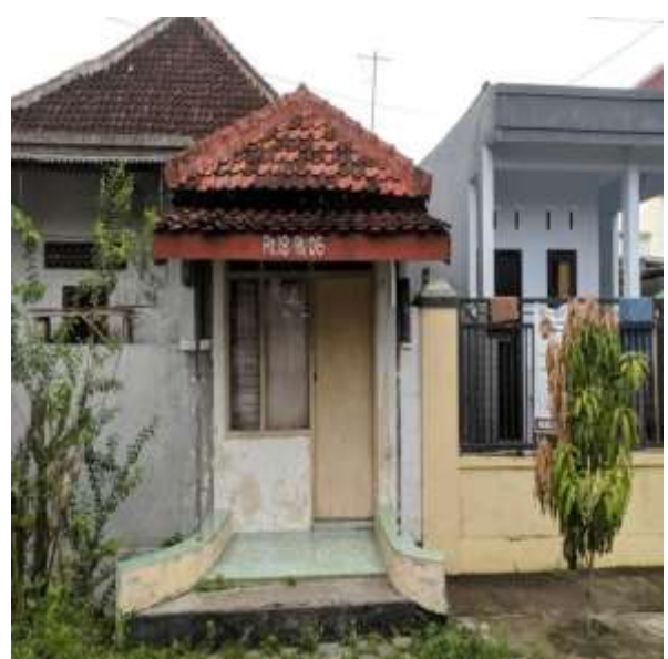
POS KAMPLING RT 18 RW 06