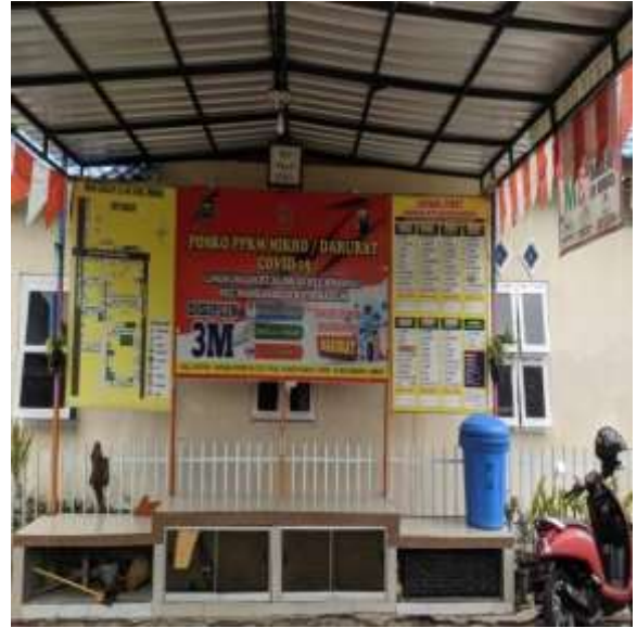
POS KAMPLING RT 26 RW 08