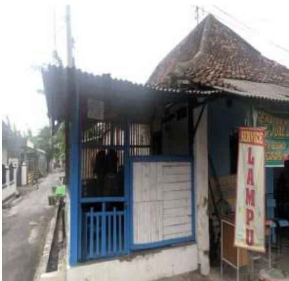
POS KAMPLING RT 23 RW 07