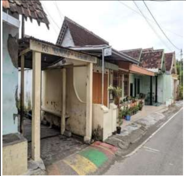
POS KAMPLING RT 10 RW 03