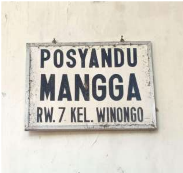
POSYANDU MANGGA RW.07