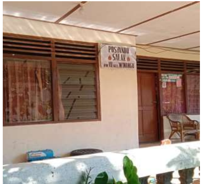
POSYANDU SALAK RW.08