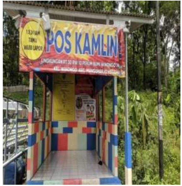
POS KAMPLING RT 30 RW 10