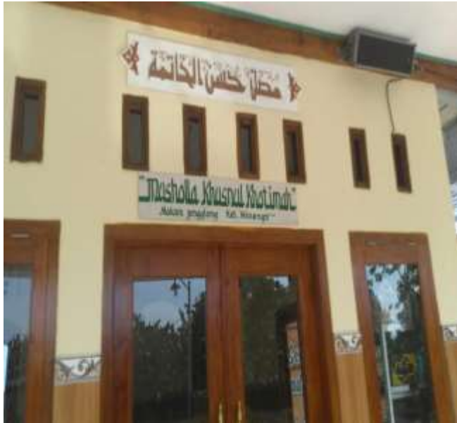
MUSHOLA KHUSNUL KHOTIMAH