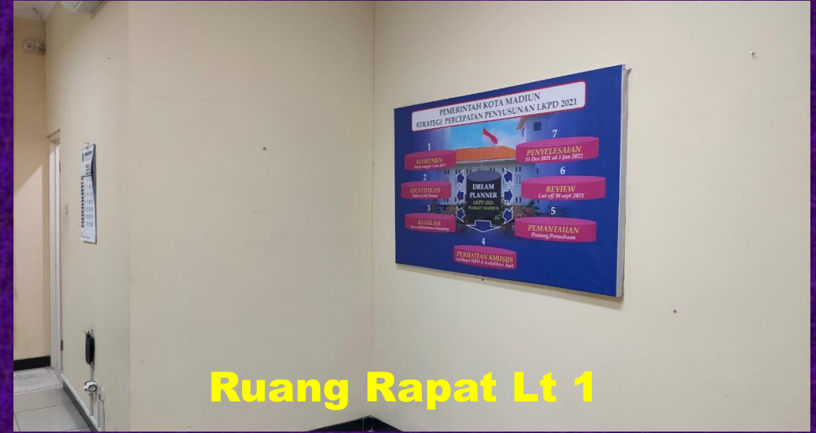
Ruang Rapat Lt 1