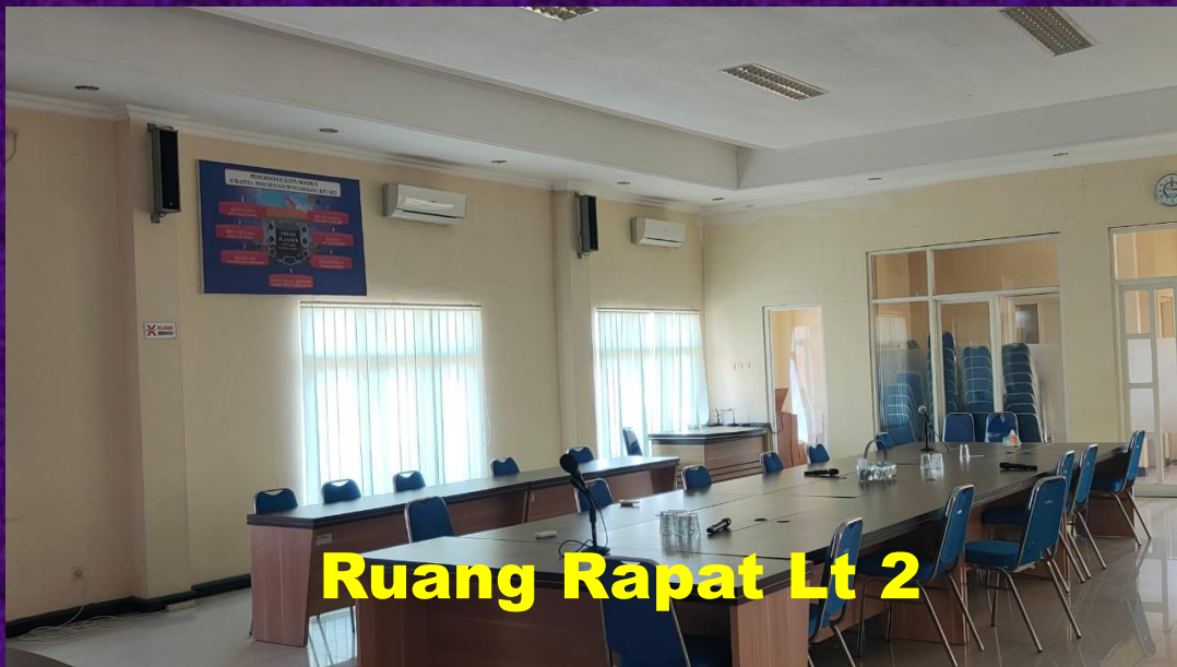
Ruang Rapat Lt 2